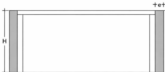
VISTA 1 1/140